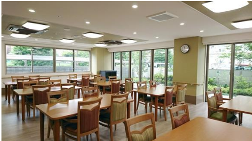
共用食堂(イメージ)

和食を中心に、管理栄養士監修の栄養バランスのとれた食事を 1 食からオーダーできます。