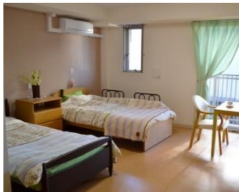
2 人用住戸(イメージ)