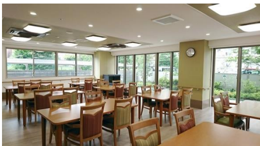
共用食堂(イメージ)

和食を中心に、管理栄養士監修の栄養バランスのとれた食事を 1 食からオーダーできます。