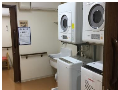
共用洗濯室(イメージ)

和食を中心に、管理栄養士監修の栄養バランスのとれた食事を 1 食からオーダーできます。